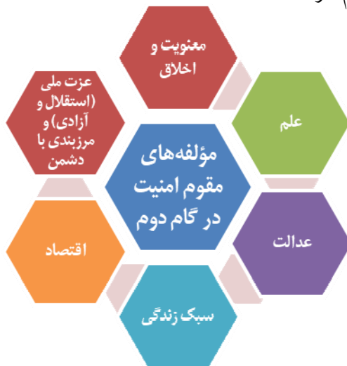
شکل ۳: مؤلفه‌های مقوم امنیت در گام دوم

نگرش و تقویت باورهای دینی، عمل به آموزه‌های دینی از سوی رهبران دینی و مدیران نظام، ترویج فرهنگ صحیح استفاده از رسانه، اصلاح مدیریت رسانه‌ها، نهادینه شدن فرهنگ نظارت و تقویت روحیه جهادی (عیسی‌زاده و عراقی، ۱۳۹۸: ۱). اتخاذ سبک زندگی مورد نظر در بیانیه گام دوم، موجب تقویت سرمایه اجتماعی شده و همان طور که پیشتر ذکر شد، سرمایه اجتماعی نقشی بسیار مهم در دفاع نهادینه و پایدار بر اساس مؤلفه‌های قدرت نرم دارد.