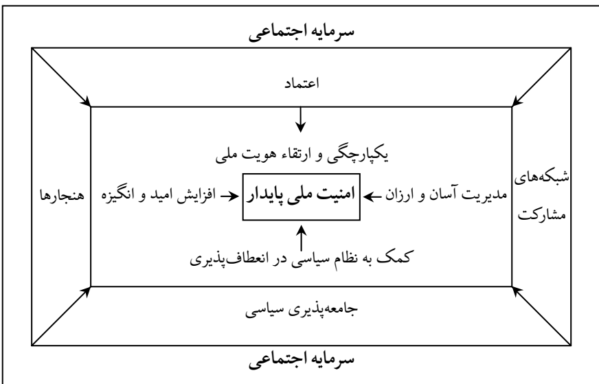
شکل ۲: میزان و نحوه تأثیرگذاری سرمایه اجتماعی بر امنیت داخلی (عباس‌زاده و کرمی، ۱۳۹۰: ۵۵)

بر این اساس می‌توان گفت کشوری که دارای عناصری چون ثبات سیاسی، پاسخگویی، انسجام و آگاهی اجتماعی، دلبستگی ملی، هویت جمعی، تعهد و رضایتمندی باشد، از قابلیت اثرگذاری بیشتری برخوردار است و قدرت نرم آن افزون‌تر از کشورهای دیگر است. هر چقدر انسجام ملی یک جامعه بیشتر باشد، آن جامعه از قدرت نرم بیشتری برخوردار است و بیشتر قادر است که نتایج بهینه‌تری کسب کند و در مقابل تهدیدات داخلی و خارجی، واکنش دفاعی کارآمدتری نشان دهد. بنابراین از آنجا که سرمایه اجتماعی نقشی بسیار مهم در افزایش اعتماد و وفاداری ملی به دولت و به تبع آن افزایش مشروعیت سیاسی دارد، می‌تواند به عنوان یکی از مؤلفه‌های اساسی افزایش قدرت نرم در حوزه دفاعی مورد توجه قرار گیرد (قربانی شیخ‌نشین و همکاران، ۱۳۹۰: ۱۹).