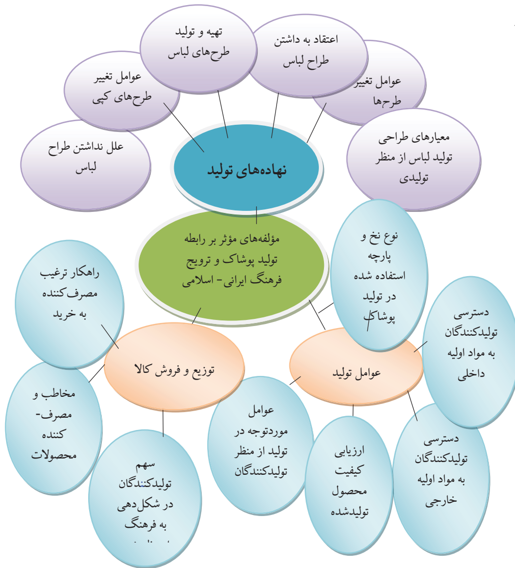
شکل ۳ - شمای کلی مؤلفه‌های استخراج شده از مصاحبه